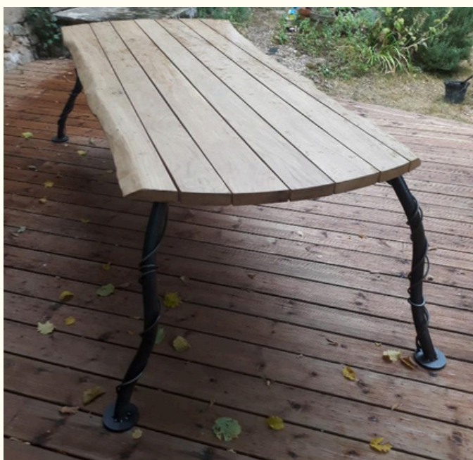
Table de jardin, chez un particulier. Réalisation par Francky. .