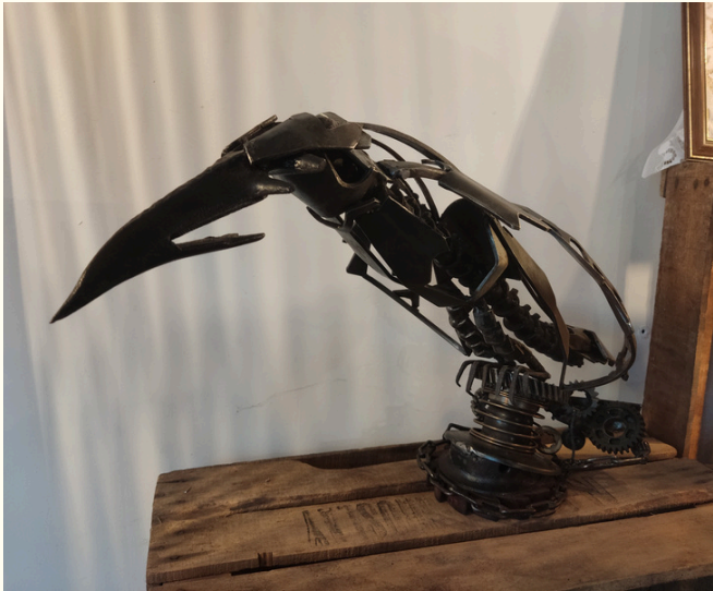
Le Piaf. Réalisation de Louis.